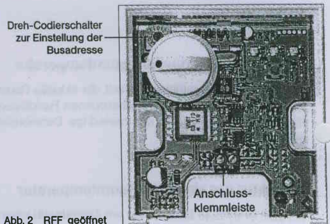
Abb. 2 RFF geöffnet

Fernbedienung geöffnet (Frontdeckel entfernt)